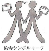
協会シンボルマーク